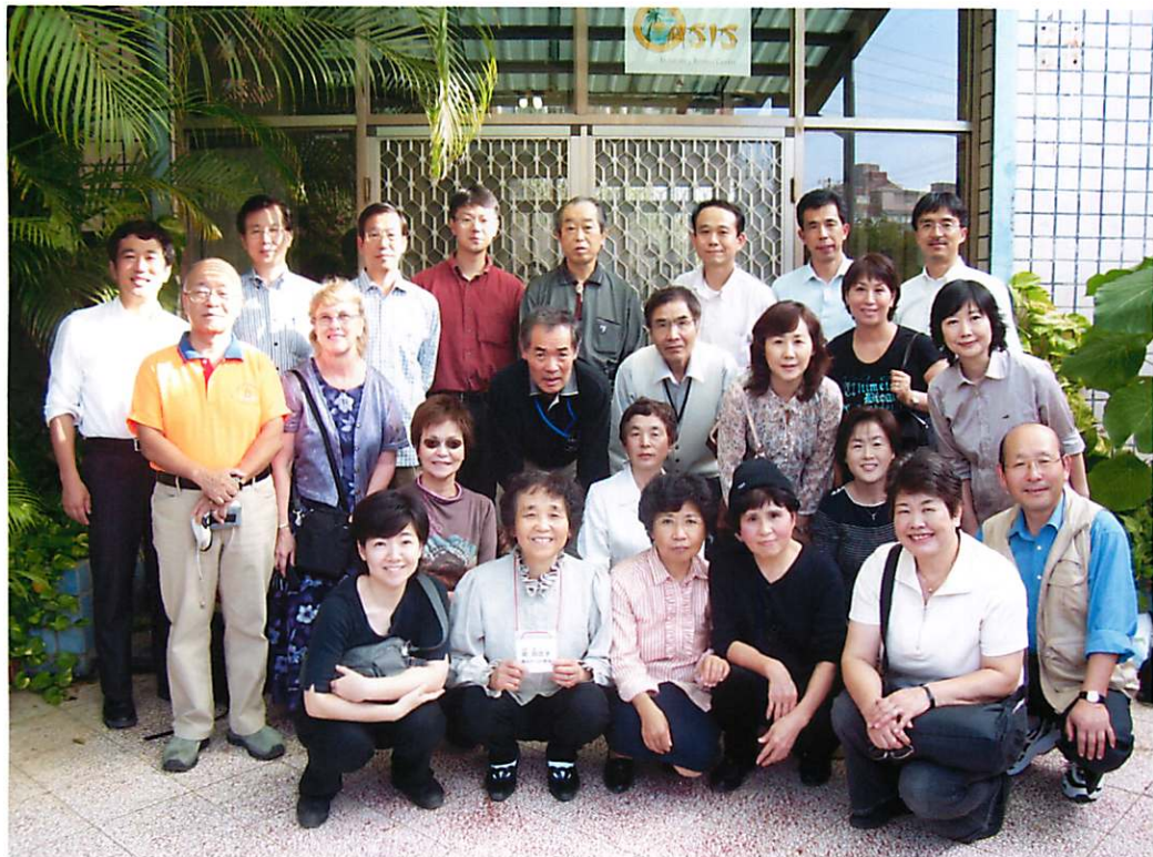
4日目 宣教師研修センター (オアシス・リトリート・センター) にて