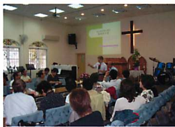
屏興教会での講演