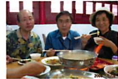
おいしいお昼に大満足