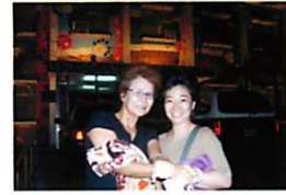
墾丁の夜店 カラフルな警察署の前で記念撮影