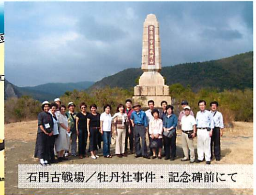
石門古戦場/牡丹社事件・記念碑前にて