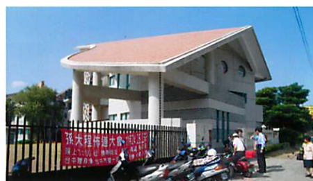
アイジャ 愛家教会 (台中) ※斎藤師一家が、出席・奉仕している教会