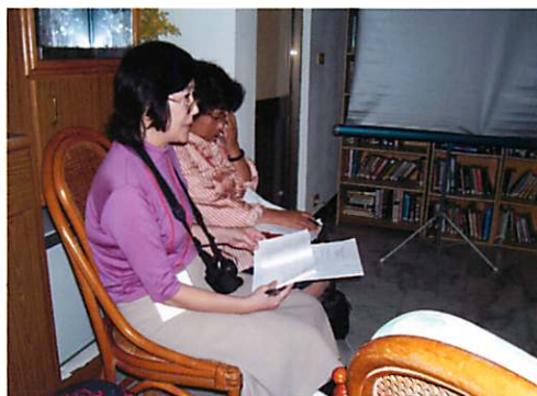
最後の晩 台湾での体験をわかちあい 「私たちにできること」を話し合いました。